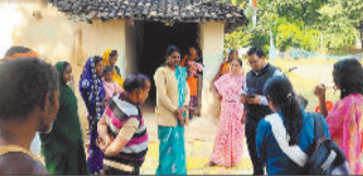
किए जा रहे इन प्रयासों के लिए विद्यालय को देश के 75