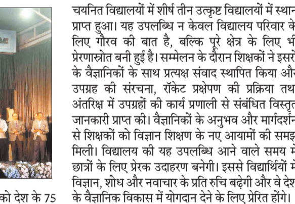
किए जा रहे इन प्रयासों के लिए विद्यालय को देश के 75

स्तरीय विज्ञिया जाति सम्मेलन में सरपंचों द्वारा मुख्यमंत्री को एम्स खुलवाने हेतु हस्ताक्षरित ज्ञापन सौंपा गया था, परंतु अब तक कोई कार्रवाई नहीं हुई है, उन्होंने अंबिकापुर से हाथीनाला तक 140 किलोमीटर लंबे राष्ट्रीय राजमार्ग निर्माण की भी मांग की है, यह सड़क बनारस-अंबिकापुर-बिलासपुर-रायपुर-नागपुर-विशाखापट्टनम को जोड़ देगी, जो पूर्व-पश्चिम कॉरिडोर के समान महत्व रखेगी, उन्होंने कहा कि यह परियोजना यदि अमल में आती है तो उत्तर भारत के बाजार सीधे विशाखापट्टनम बंदरगाह से जुड़ जाएंगे, इससे न केवल व्यापार बढ़ेगा, बल्कि छत्तीसगढ़ की अर्थव्यवस्था में नई ऊर्जा का संचार होगा, राष्ट्रपति के गोद पुत्र पंडोनागर में आज भी उपेक्षा का वातावरण है। वर्ष 1952 में प्रथम राष्ट्रपति डॉ. राजेंद्र प्रसाद ने इसे गोद लिया था, पर आज भी उस क्षेत्र का विकास अधूरा है।