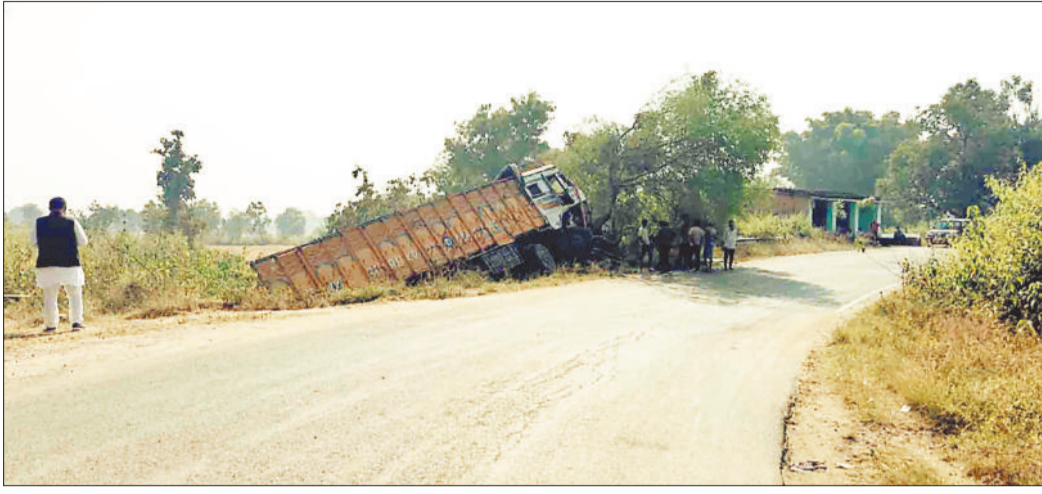
मोड़ पर दुर्घटनाग्रस्त ट्रक।

हरिभूमि न्यूज ►► भैयाथान एक तरफ जिले में सड़क दुर्घटनाओं में होने वाली मौतों के प्रति लोगों को जागरूक करने शिविर सहित विभिन्न आयोजन के माध्यम से जागरूक किया जा रहा है। ज्यादातर सड़क दुर्घटनाओं और उससे होने वाली मौतों के लिए जिम्मेदार ब्लैक स्पॉट में सुधार की दिशा में शासन प्रशासन द्वारा कोई पहल नहीं की जा रही है। ऐसे में अब स्टेट हाइवे 12 के पटना-भैयाथान मार्ग पर ग्राम बसकर में बना 90 डिग्री का मोड़ अब जानलेवा ब्लैक स्पॉट बन चुका है। दुष्प्रवाहित होने और सड़क सुरक्षा मानकों की अनदेखी के कारण यहां लगातार दुर्घटनाएं हो रही हैं।